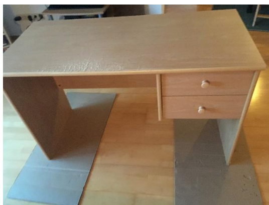
Schreibtisch aus Spanholz

Irgendwann kommt jedes Möbelstück einmal in die Jahre. Gerade Möbel aus Spanholz sehen nach einigen Jahren nicht mehr schön aus. Bevor Sie diese entsorgen und neu kaufen, können Sie ihnen aber auch mit Möbelfolie (DC-Fix) einen ganz neuen Look verabreichen. Das ist günstiger und auch besser für die Umwelt.